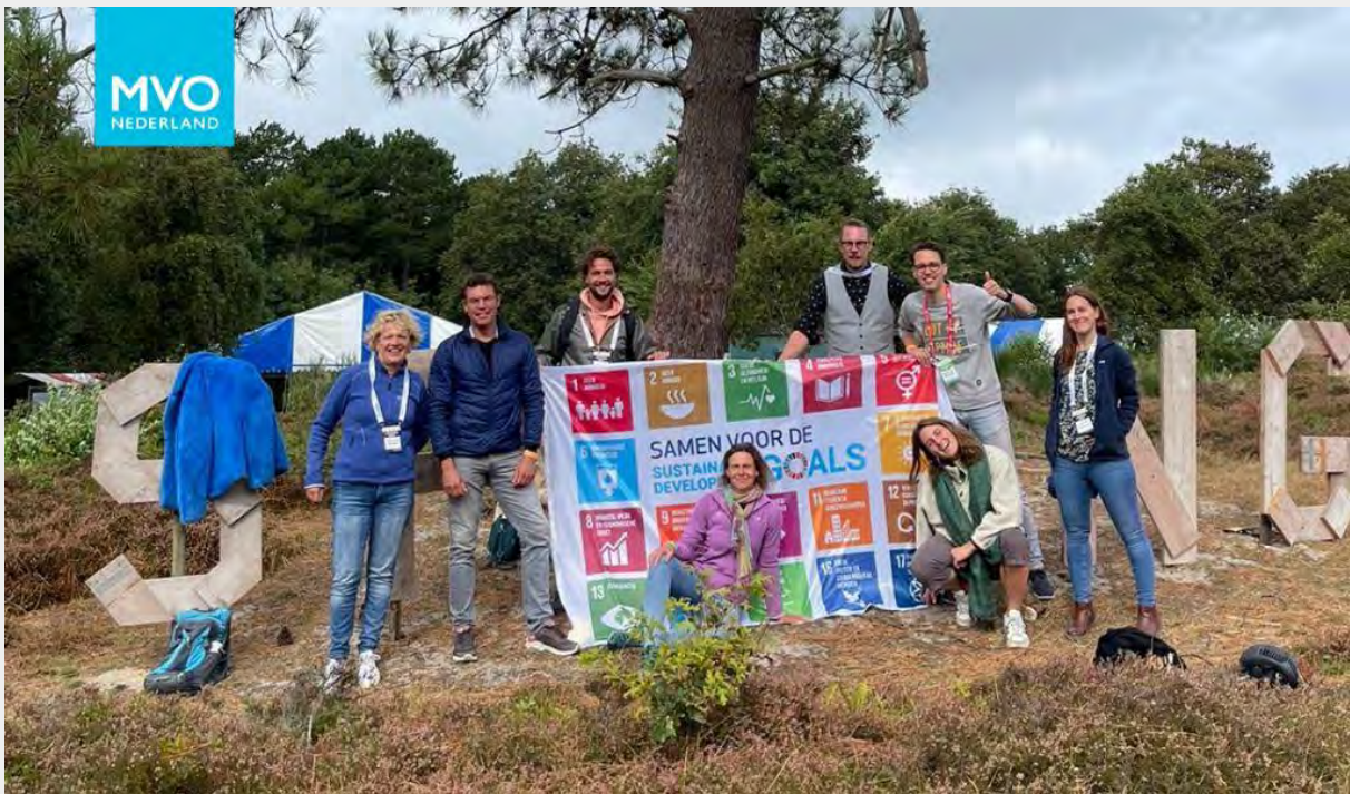
MVO Nederland met een afvaardiging op het Springtij-festival

Reageren op dit jaarverslag is mogelijk. Dat kan via contact@mvonederland.nl of onze website . Daar vind je ook de eerder jaarverslagen.