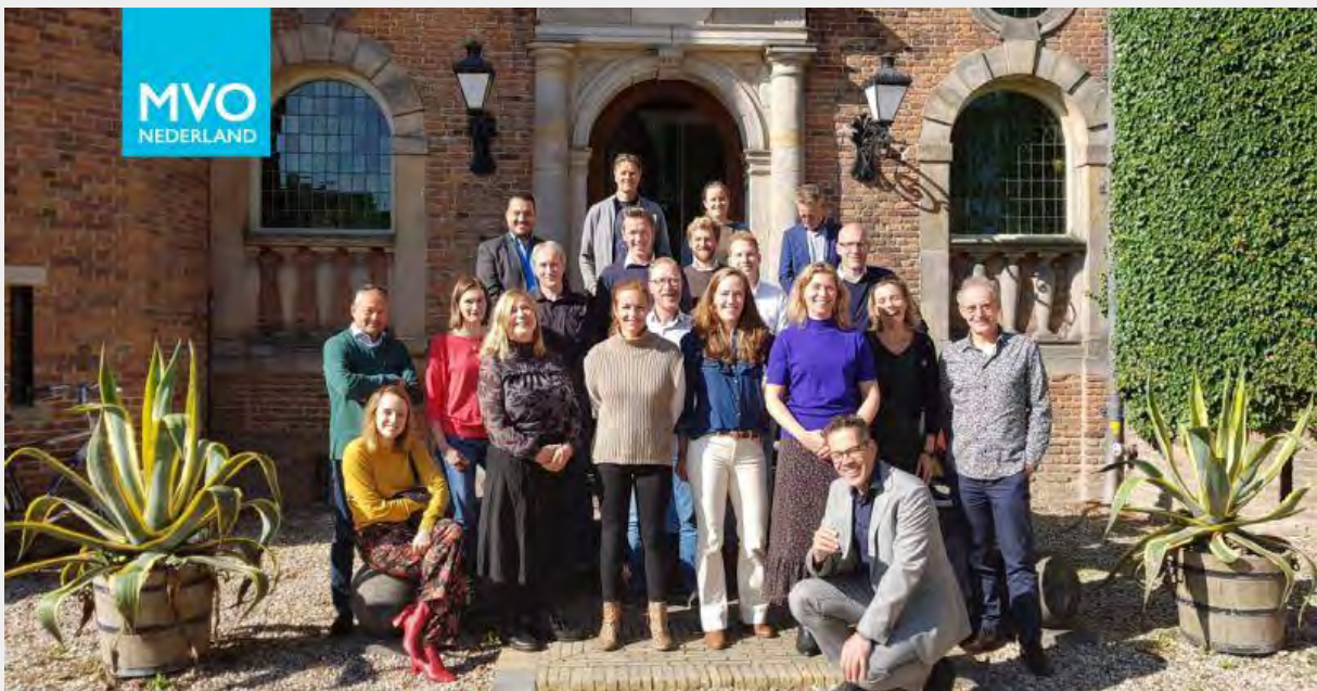
Groepsfoto van de MVO Expeditie 2021

20 duurzaamheidsprofessionals tilden in 2021 hun werk naar een hoger niveau met hun deelname aan de MVO Expeditie, een praktijkgerichte mvo-opleiding in samenwerking met Nyenrode Business Universiteit.