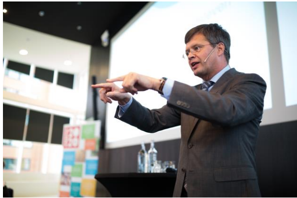
Jan Peter Balkenende spreekt op de GBN-bijeenkomst 'Sustainable Development Goals als kompas voor bedrijven naar 2030.'

RWS officieel toegetreden tot de Groene Netten Coalitie. Tevens heeft de coalitie het Petaplan gepresenteerd, dat ertoe moet leiden dat de hele Nederlandse infrastructuur energieneutraal wordt.