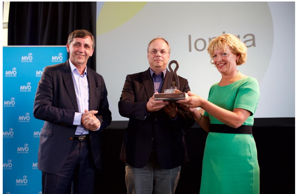
De start-up loniqa ontvangt de Ambitie 2020 Challenge Award op dinsdag 28 juni 2016.

Op het nieuwjaarsevent van 2014 lanceerden we onder de naam Ambitie 2020 een programma dat als doel heeft "Nederland wereldvoorbeeld van een circulaire en inclusieve economie". In 2016 leverde dat onder meer de volgende resultaten op: