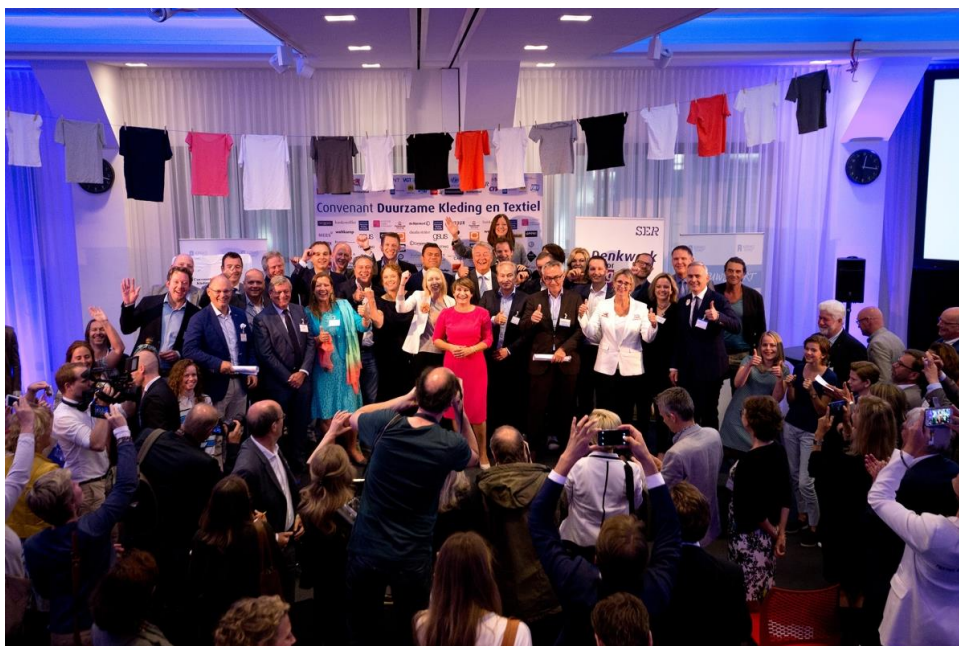
Convenant Duurzame Kleding en Textiel

In 2016 werd het vierjarige IMVO-programma afgerond. Het programma heeft activiteiten in Albanië, Bangladesh, China, Colombia, Costa Rica, Ethiopië, Ghana, Honduras, Indonesië, Macedonië, Kenia, Oeganda, Sri Lanka en Suriname.