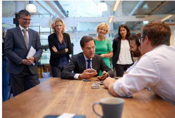
In oktober 2016 nam MVO Nederland premier Rutte mee naar smartphonemaker Fairphone en een delegatie van het Betonakkoord.

MVO Nederland onderneemt verschillende activiteiten met en voor het Nederlandse bedrijfsleven in het realiseren van een klimaatneutrale, circulaire en inclusieve bedrijfsvoering. De activiteiten zijn onder te verdelen in: informatie & opinie en netwerken & coalities.