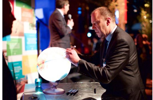
De Nederlandse Klimaatcoalitie verwelkomt zijn 500 ste deelnemer.

Sinds de oprichting van de Nederlandse Klimaatcoalitie (NKC) in het najaar van 2014, een initiatief van MVO Nederland, Natuur en Milieu, Klimaatverbond Nederland en het ministerie van IenM, is de coalitie uitgegroeid tot een platform van ruim 650 deelnemende publieke en private organisaties. Al deze deelnemers hebben de ambitie om klimaatneutraal te worden, de huidige CO 2 -footprint transparant te maken en de komende jaren concrete stappen te zetten om deze te verlagen.